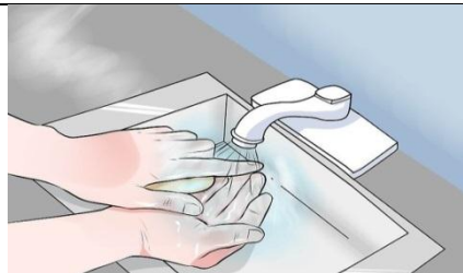
دستها را مجدداً بشویید و دستکش جدید بپوشید.