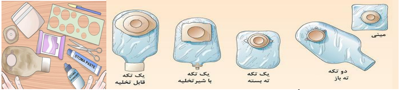
نمونه هایی از انواع مختلف بگ کلتومی

وسایل را آماده کنید: کیسه متناسب با اندازه استوما، نرمال سالین، دستکش تمیز، چند عدد گاز، کیسه زباله