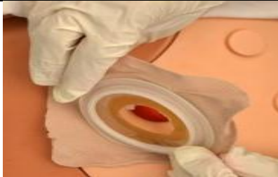
کیسه پر را از محل استوما جدا کنید.