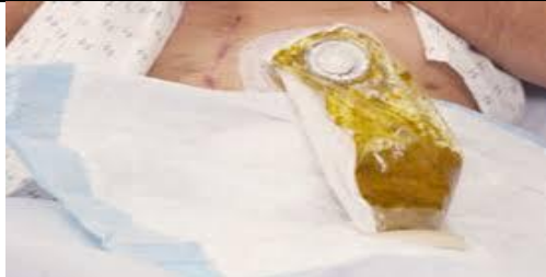
مایع دفع شده در کیسه را اندازه گیری نمایید.