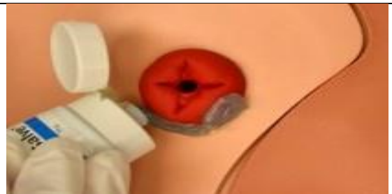
یک لایه از پماد ضد سوختگی را روی پوست اطراف استوما بیافزایید.