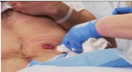
پوست اطراف استوما را توسط گاز به صورت کامل خشک کنید.