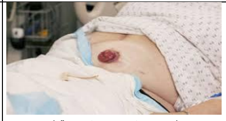
مددجو را در پوزیشن نیمه نشسته قرار دهید و پوشش های روی ناحیه زخم را بردارید.