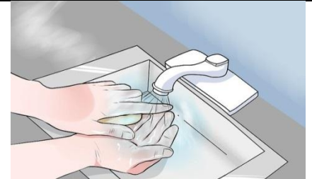
دستها را بشویید.